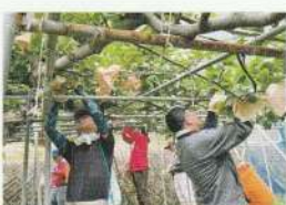
農業担い手育成塾 果樹コース