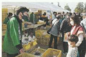
えひめ・まつやま産業まつり

農産物の調整・管理・販売までを学生自らが行き、流通と販売のしくみを学ぶとともに、消費者の声を直に聞くことで経営感覚を養います。