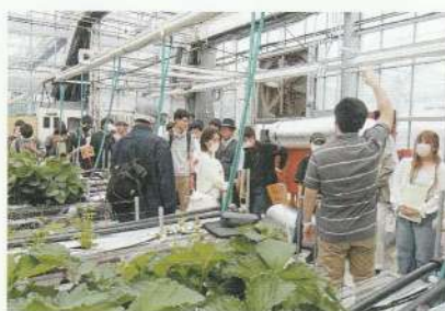
環境モニタリング技術視察(福岡県)

全国でも先進的に取り組んでいるデジタルツール活用事例やスマート農機など、最先端の技術に触れることができます。