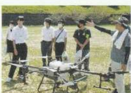
就農啓発オープンカレッジ