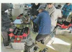
農業機械士養成研修