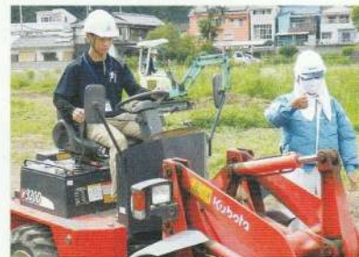
小型車両系建設機械運転特別教育